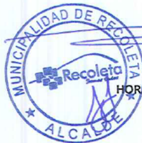
HORACIO NOVOA MEDINA ALCALDE (S)